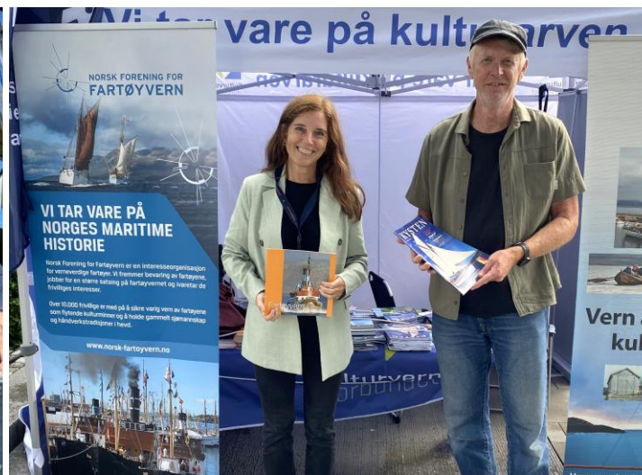
Norsk Forening for Fartøyvern og Forbundet KYSTEN på Arendalsuka