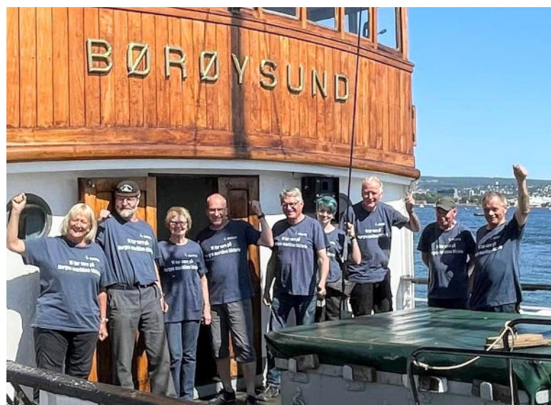
Fartøyvernets dag hos BØRØYSUND