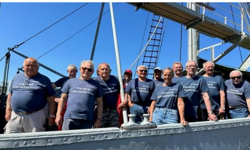
Fra Fartøyvernets dag om bord i SOUTHERN ACTOR

Arbeidsprogrammet 2023 ble utarbeidet av styret med innspill og vedtak fra årsmøte 2022. Arbeidsprogrammet har som visjon å skape forståelse og engasjement for fartøyvernet. For å få til dette må foreningen være en samlende organisasjon, sette dagsorden, være høringsinstans, styrke medlemskontakten, kommunisere synspunkter og få økte bevilgninger til fartøyvernet. Dette er bakteppe for alle foreningens oppgaver og som foreningen kontinuerlig jobber for. I 2023 ble det spesielt lagt vekt på interessepolitikk for å øke post 74, rekruttering, medlemskontakt og synliggjøring av fartøyvernet og våre frivillige. Rekruttering ble gjort gjennom prosjektet Fartøyvern for Fremtiden. Interessepolitikk ble gjort gjennom innspill, høringer, politiske møter og turer. Medlemskontakt ble gjort gjennom å arrangere to regionsamlinger (Oslo og Nordland), mens synliggjøring ble gjort gjennom både Arendalsuka og gjennom aksjonen «Fartøyvernets dag» - på samme dag til samme klokkeslett samlet verneverdige fartøy seg over hele landet i sin lokale havn og blåste i fløyta, samt inviterte til åpen båt og ulike arrangementer.