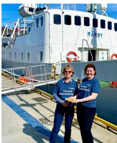
Fra Fartøyvernets dag: MÅRØY, BOLGA og GLIMTS venner (GLIMT II).

Sekretariatet sendte i forkant ut en pressepakke til medlemsfartøyene som inneholdt innbydelser, pressemelding og forslag til innlegg i lokalmedia om fartøyvern. Det ble i tillegg trykket opp og delt ut t-skjorter til våre frivillige med påskriften «Vi tar vare på Norges maritime historie» samt foreningens logo. Foreningen annonserte også for markeringen på Facebook og Instagram, både med nasjonal og lokal rekkevidde. Dette resulterte i en økning av rekkevidden på over 400 % for foreningens Facebookside i juni på grunn av Fartøyvernets dag, nye likerklikk økte med 580 %. Annonseringen ga således gode resultater med å synliggjøre fartøyvernet og våre frivillige. Foreningens visjon er å skape forståelse og engasjement for fartøyvernet i Norge. Denne markeringen bidrar til dette.