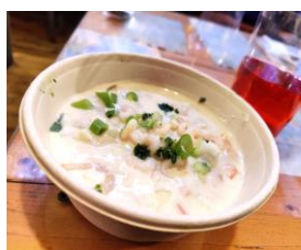
Fiskesuppe om bord på HINDHOLMEN var en flott avslutning på årsmøtet i Ålesund

Et verktøy til å hjelpe oss er kommunikasjonsstrategien som foreningen utarbeidet i 2022. Denne kan hjelpe alle i årene som kommer – sekretariat, tillitsvalgte og frivillige – med å jobbe samstemt, slik at oppmerksomhet i offentligheten bidrar til gjennomslag i politikken. Foreningens mål er å skape forståelse og engasjement for fartøyvernet i Norge, øke bevilgningene til fartøyvernet og rekrutteringen av frivillige.