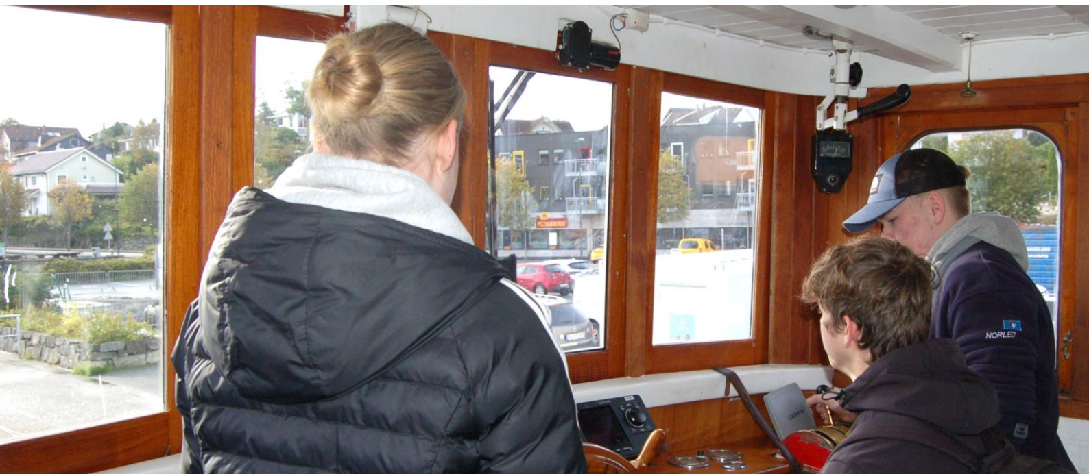
Deltakere i Fartøyvern for fremtiden om bord i RISKAFJORD

bærekraftperspektiv ble prioritert. I 2023 var det 10 medlemsmiljøer som fikk tildelt midler etter søknad: ANNA ROGDE, BOLGA, FREMAD II, GAMLE KRAGERØ, GAMLE MÅRØY, IMMANUEL, SENJAPYNT, RISKAFJORD, SOLRIK og SVANEN. Det var også noen prosjekter fra 2022 som ble forlenget til 2023. Dette gjaldt MOHAWK og BILFERGEN. Det er også blitt laget små filmsnutter om prosjektet som er rettet inn mot å rekruttere unge.