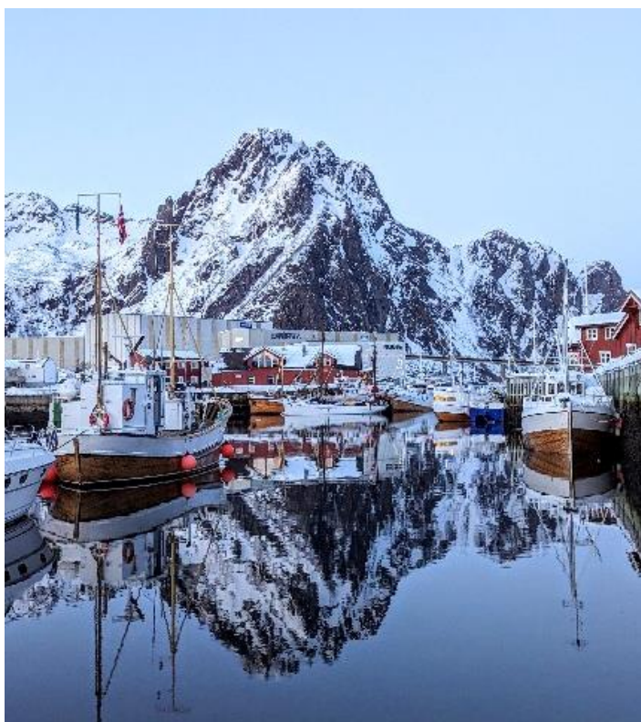
Fra styremøte og regionsamling i Svolvær i mars. Avbildet: NYKVÆRING (t.v.), ANNE BRO og FOLKVANG (bak).

Norsk Forening for Fartøyvern ble stiftet i 1985. Foreningens formål er å fremme bevaring og varig vern av verneverdige fartøy. Foreningen skal også utvikle og styrke de menneskelige ressurser og materielle vilkår knyttet til vernearbeidet. Medlemsfartøyene utgjør en variert samling av dekkete eller større åpne fartøyer, fra fiskefartøyer, redningsskøyter, ga-leaser, jakter til slepebåter og passasjerskip. Fartøyene er lokalisert langs hele kysten, i innsjøer og på kanaler.