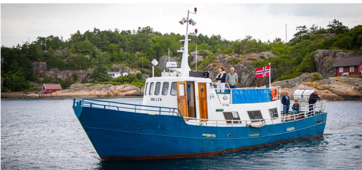
HØLLEN ble medlem i foreningen fra 1.1.2023

Medlemsfartøyet «Løfjell» meldte seg ut av foreningen i 2023. Foreningens medlemskontingent beregnes ut fra brutto registertonn. Størrelsen på kontingenten gjenspeiler også stemmetall på årsmøtet. Medlemskontingenten i 2023 var på henholdsvis 1500,- kr for fartøy under 50 br.t. og gir en stemme på årsmøtet, 3000,- kr for fartøy mellom 50 og 100 br.t. og gir to stemmer på årsmøtet og 4500,- kr for fartøy over 100 br.t. og gir tre stemmer på årsmøtet. 1 fartøy sto til rest med medlemskontingent per 31. desember 2023.