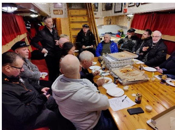
Fra regionsamlingen i Svolvær om bord på ANNE BRO.