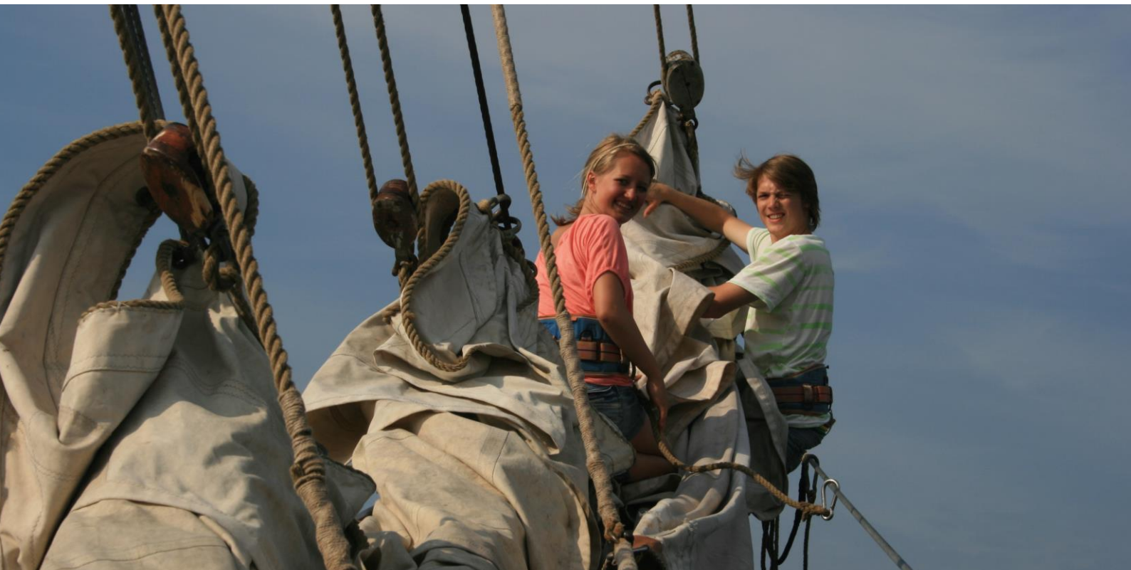
Frivillige er fartøyvernets bærebjelke

arbeidsplasser innen kulturbasert reiseliv. Dessverre ble det ikke satt av ekstra midler på statsbudsjettet til istandsetting og vedlikehold av vernede fartøy, men Regjeringen opprettet en krisepakke som – etter påtrykk fra foreningen – inkluderte tapte inntekter for vernede fartøy i drift. Flere av foreningens medlemsfartøy fikk midler herfra etter søknad. Ordningen ble administrert av Lotteri- og stiftelsestilsynet.