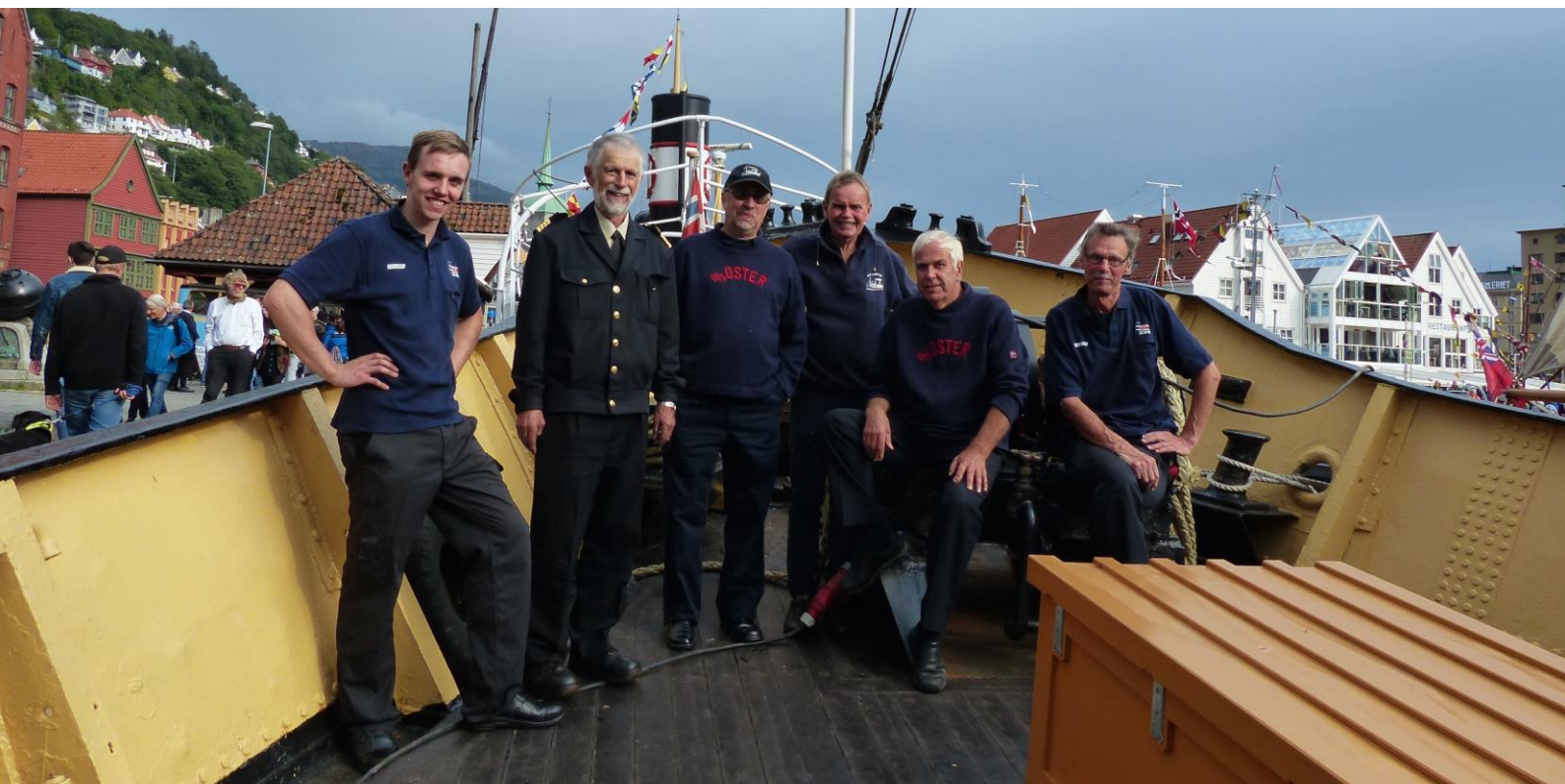
Frivillige om bord på OSTER